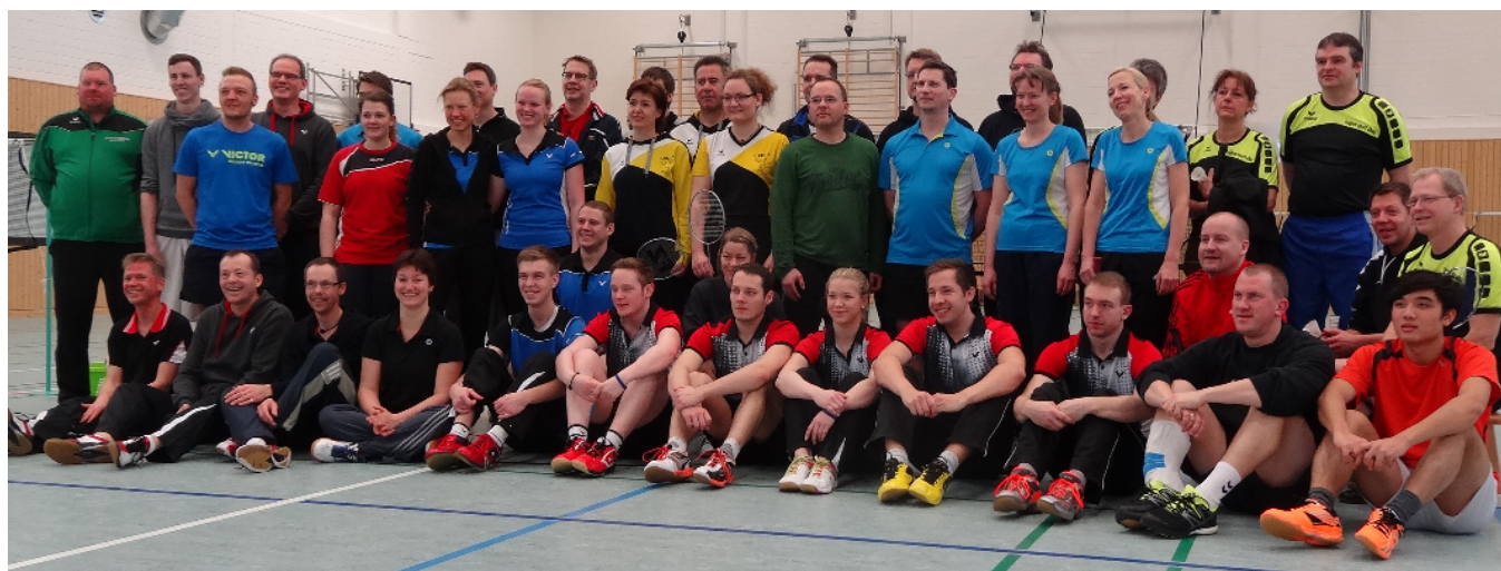
Todenbüttel: Hier alle teilnehmenden Mannschaften im Gruppenbild