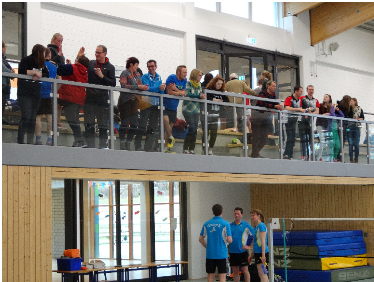
Blick auf die Zuschauerränge in Todenbüttel

-> der Sieger kommt in das Spiel um Platz 3 -> der Verlierer zieht in das finale Abstiegsspiel gegen die SG Lohe-Rickelshof/Heide 3 ein